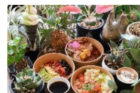
SULK GREEN CAFE