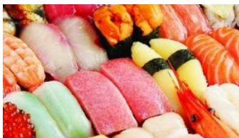
大起水産回転寿司