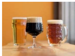
Beer & Play Station ちるちる