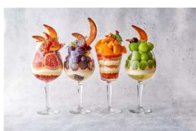
PARFAIT de MERRILY