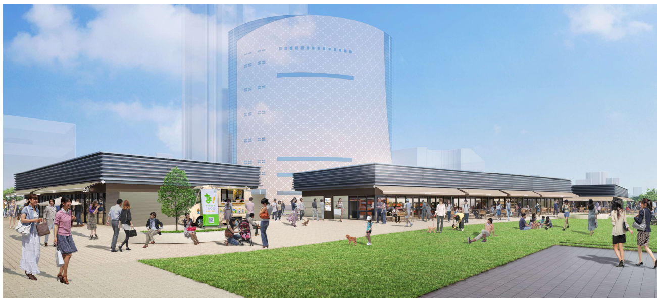
商業施設『なノにわ』のイメージ（南東側より）

『難波宮跡公園「みんなのにわ」プロジェクト（以下「本グループ」）』（代表構成員：NTT 都市開発株式会社）は、公園と一体となった商業施設『なノにわ』を 2025 年 3 月 28 日（金）に開業することをお知らせいたします。