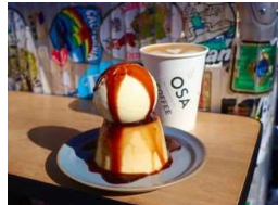
OSA COFFEE Parks