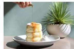
MICASADECO THE PARK

フルーツパフェ専門店として人気の「PARFAIT de MERRILY」は、パティシエ特製のテイクアウトメニューを新たに用意し、カフェ業態として新登場いたします。