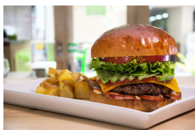
Craft Burger co.