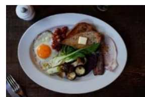
THE PORT -on the Green-