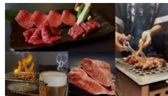
浪華焼肉さぶろう